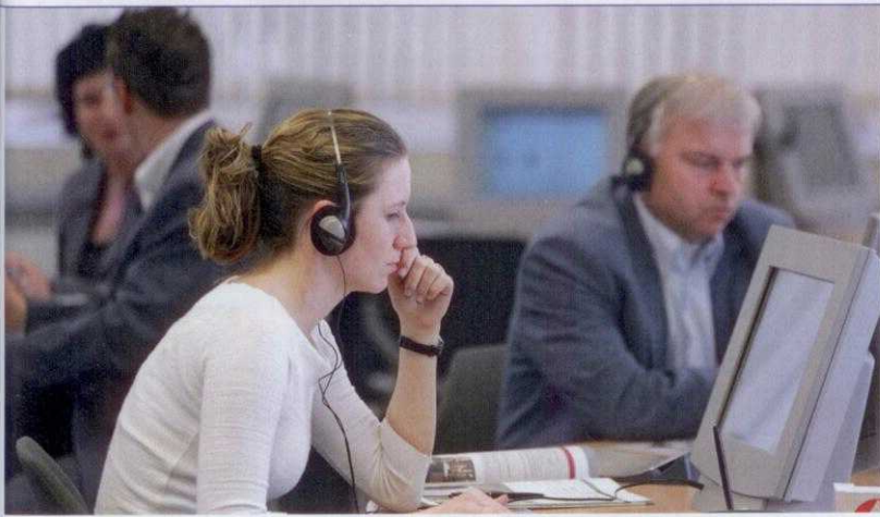
Online-Jobbörsen helfen bei der Stellensuche. Doch welche ist die Beste und worauf sollte man achten?

mehreren Diensten ist und parallel auch Kleinanzeigen betrachtet/geschaltet, Kontakte geknüpft oder Autos, Häuser und Wohnungen vermittelt werden. Das kann ganz praktisch sein, wenn man neben dem Job auch seinen Wohnsitz wechselt. Viele große Unternehmen wie StepStone oder Monster sind international aufgestellt und eignen sich daher besonders als Anlaufstelle für die Auslandsjobsuche. Die Benutzung ist denkbar simpel: Per