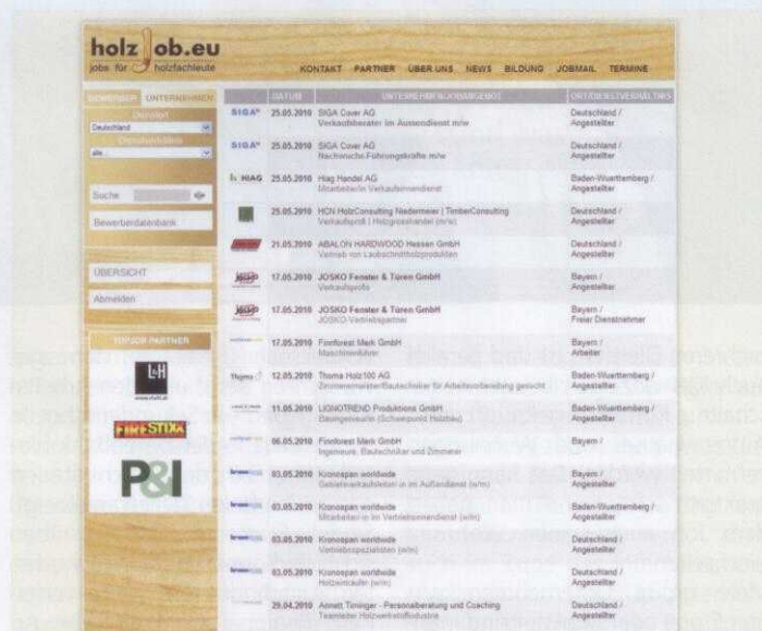
... gibt es auch einige wenige holz- und handwerkerspezifische Adressen wie z. B. HolzJob

land, lässt dies darauf schließen, dass das Unternehmen seinen Hauptsitz im Ausland hat und die Adresse sich eher für die internationale Jobsuche eignet.